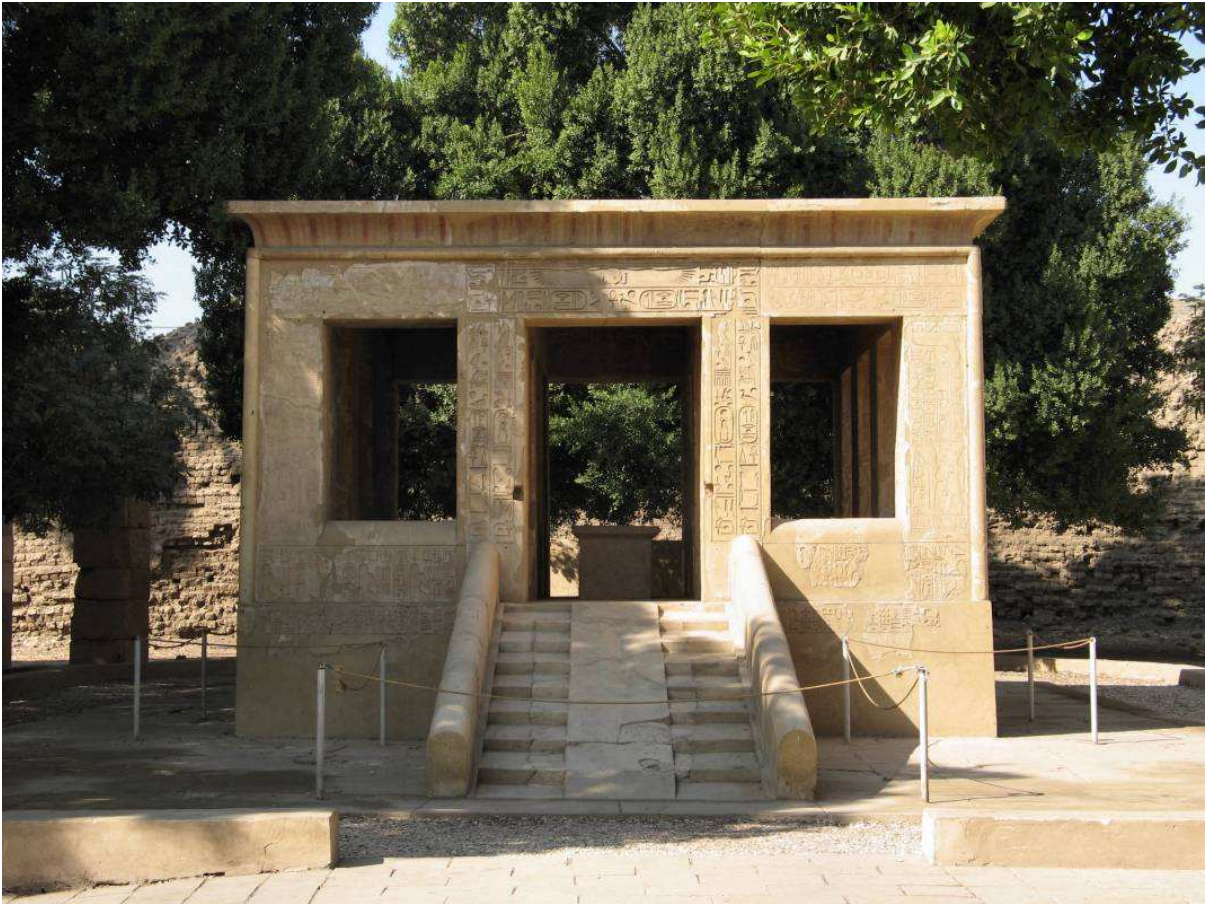
Det hvide kapel i open Air-museet i Karnak