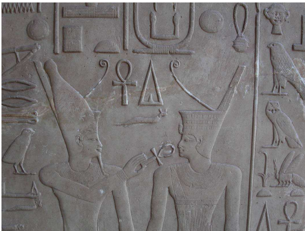
Sesostris I får livets tegn af guden Atum. Relief på det hvide kapel.

nye dæmning i perioder var oversvømmet. Her kunne man tydelig fornemme templet som en urhøj omgivet af det våde element.