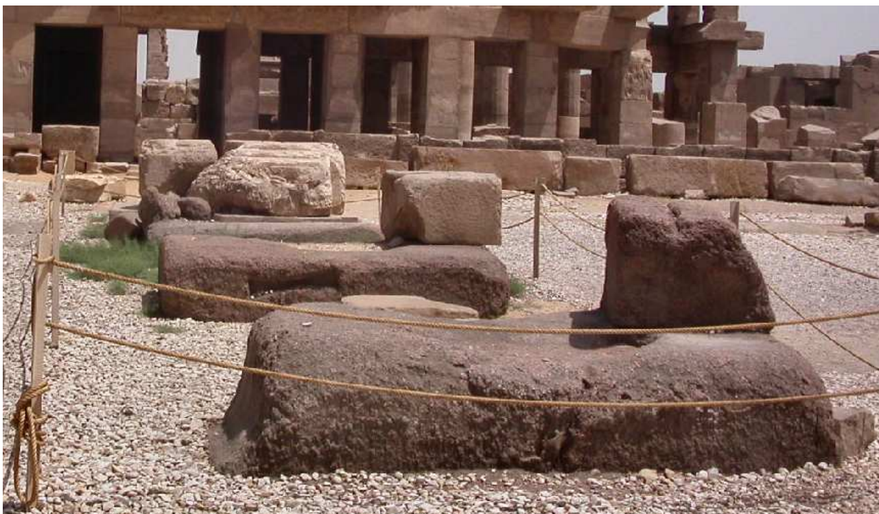
Tre granitdørtrin og en alabastblok fra Mellemste Rige

indbudt til, at templet udvidede sig mod vest. Der blev simpelthen mere og mere jord at bygge på i denne del af templet.